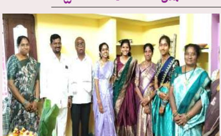
స్వర్ణసాగరం డోర్లకల్ మే 11