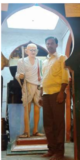
?రేడిగుంట స్వర్ణ సాగరం మే 11