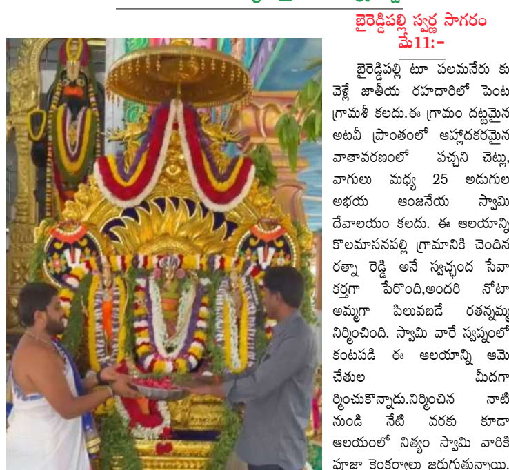
బైరెడ్డిపల్లి స్వర్ణ సాగరం మే 11:-