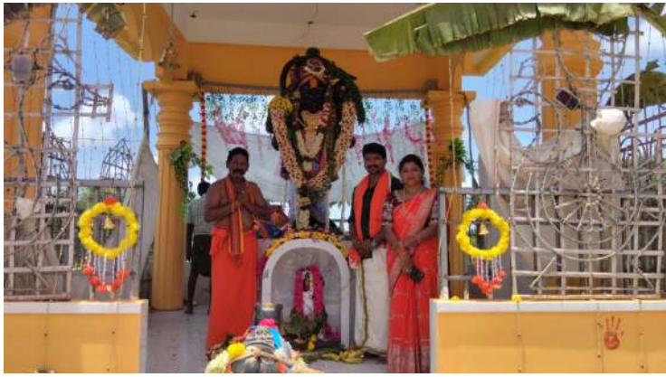
తోటపల్లి గూడూరు స్వర్ణ సాగరం మే 11

మండలంలోని తోటపల్లి గ్రామంలో సోమవారం హనుమత్ నామ సంకీర్తనలతో మేక తాళాలు మంత్రోచ్ఛరణల మధ్య శ్రీ అభయాంజనేయ స్వామి విగ్రహ ప్రతిష్ఠను ఘనంగా