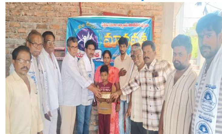
కోయ్యలగూడెం స్వర్ణ సాగరం