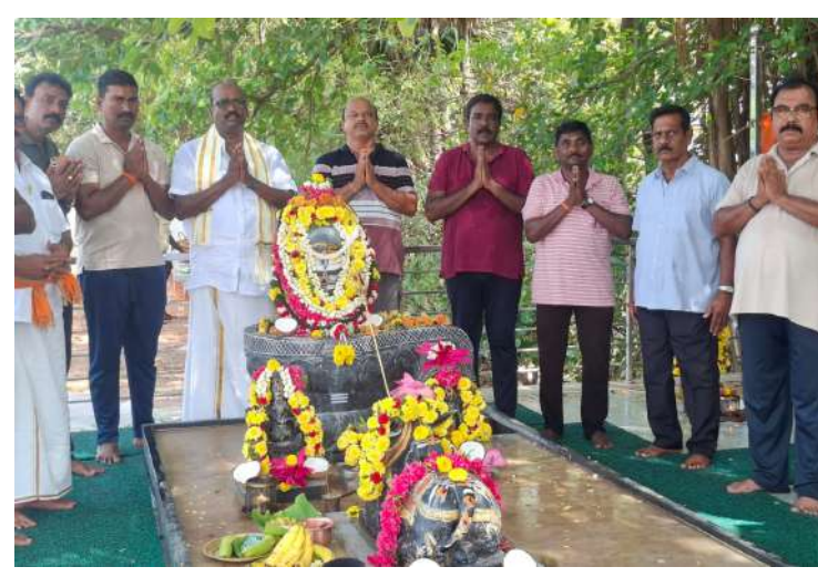
కోపూరు, స్వర్ణ సాగరం, మే 11: