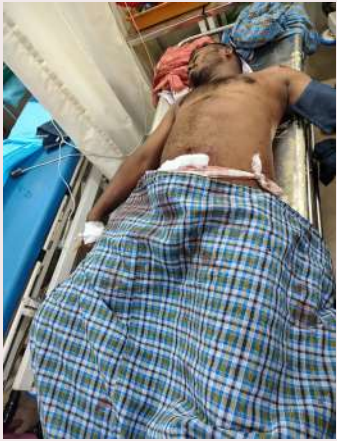
బంగారుపాలెం, స్వర్ణసాగరం, మే 11