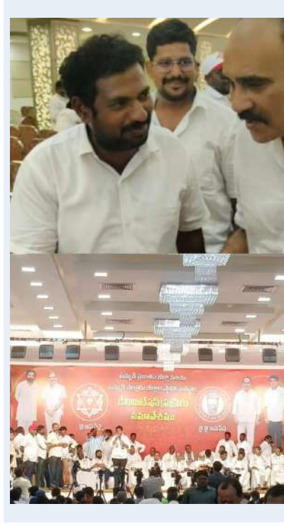
మనుబోలు, స్వర్ణ సాగరం: