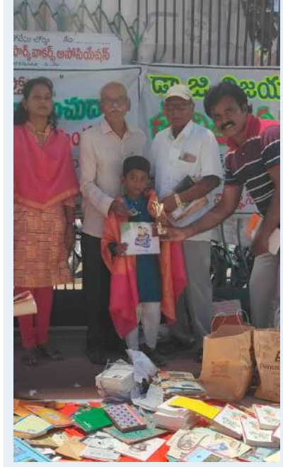
నెల్లూరు స్వర్ణ సాగరం మే 11