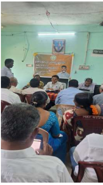
స్వర్ణ సాగరం డక్టిలి (మే, 11)