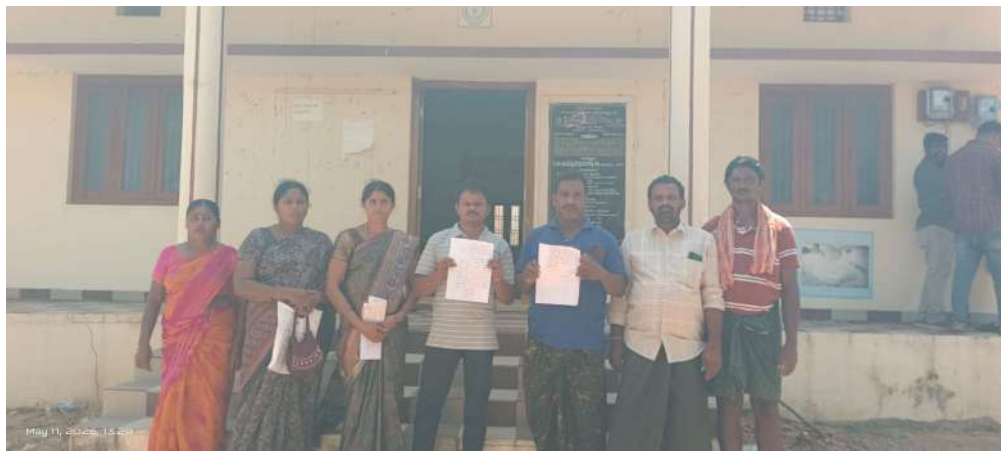
నోటీసులు పంపించి పొందుపరిచిన తేదీ లోగా కట్టవలసిందిగా తెలియ పరి చారని లేనియెడల మీ ఆస్తులు జప్తు చేస్తామని వారు తెలిపినట్లు కమిటీ సభ్యులు వాపోయారు ఈ విషయంపై సంబంధిత అధికారులకు, జిల్లా కలెక్టర్ వారికి ఆర్డీలు సమర్పించామని దానిపై విచారణకు పుత్తూరు